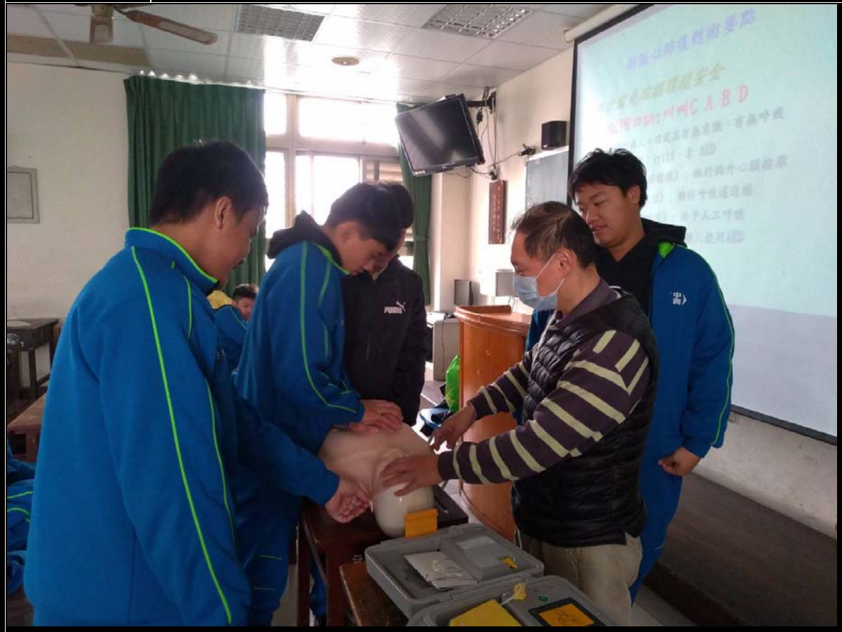
照片 2 說明 學生 AED 體驗