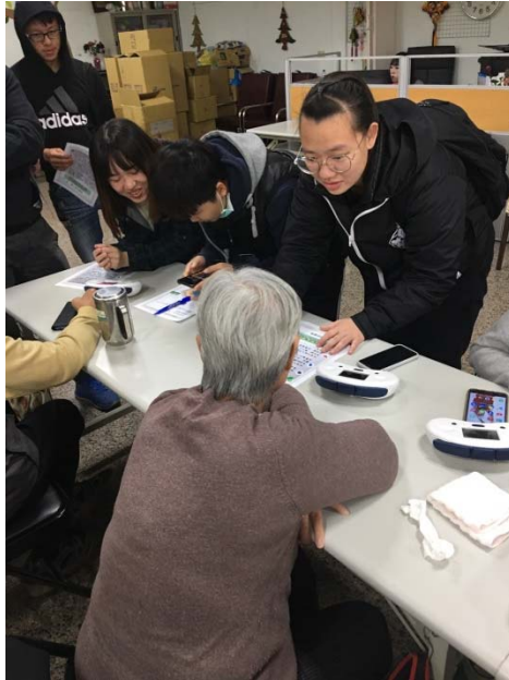
照片 2 說明 健管系學生為長輩解釋心率變異性檢測意義