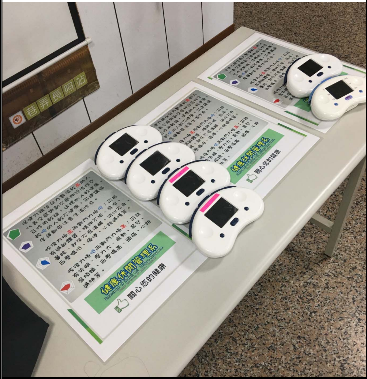
照片1說明 量測儀器及宣導品